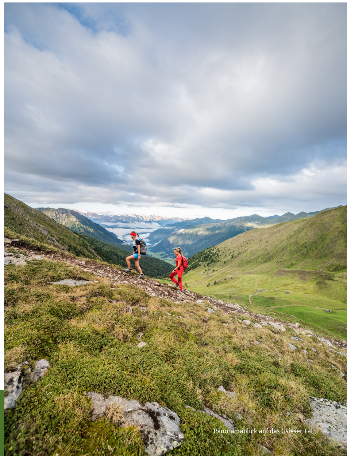
Panoramablick auf das Gsieser Tal